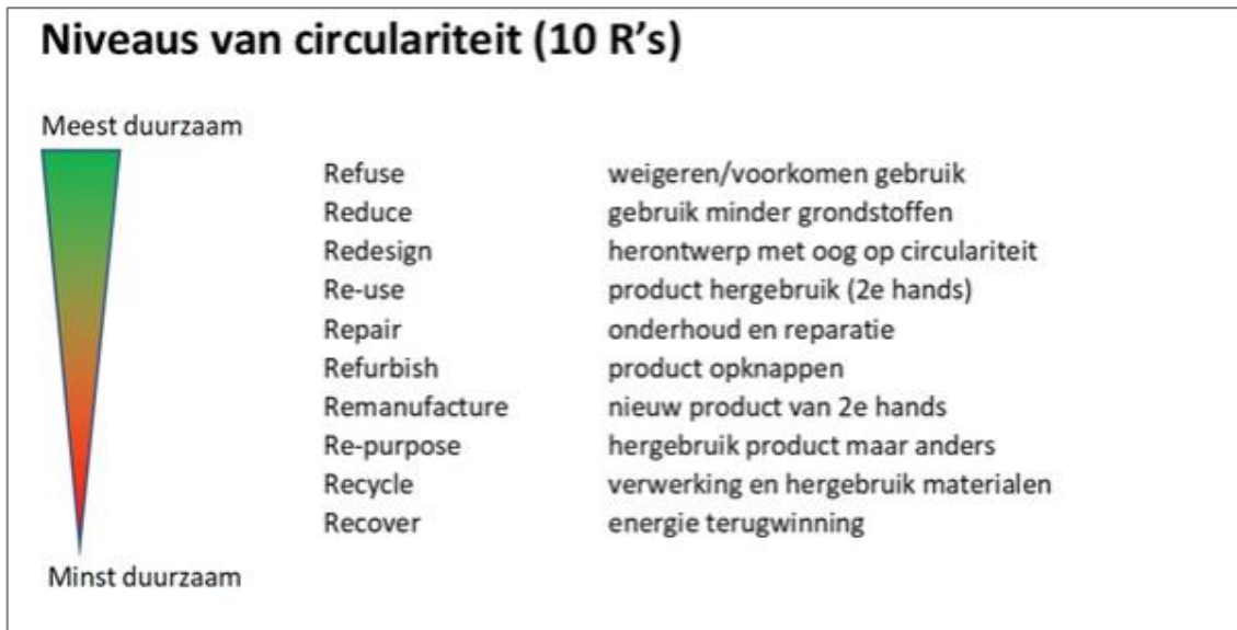
Figuur 2. Het 10R model (Prof. Jacq. Cramer, voormalig minister van VROM)

Toegepast op infectiepreventie dan is refuse het meest duurzaam en recover het minst. Bij refuse doe je een bepaalde handelingen niet (meer), je besluit bijvoorbeeld het standaard dragen schorten af te schaffen bij een bepaalde groep patiënten of medewerkers. Wanneer je besluit wel schorten te blijven dragen, maar in plaats van disposable schorten ga je over op wasbare schorten dan valt dit onder recycle en dat is minder duurzaam ten opzichte van refuse . Zo zijn er nog tal van voorbeelden te bedenken. Je kan het gebruik van papier op behandelafels op de poli afschaffen en je kan in plaats van de behandelafel standaard te desinfecteren in veel gevallen volstaan met reinigen en/of een circulair desinfectieproduct aanschaffen.